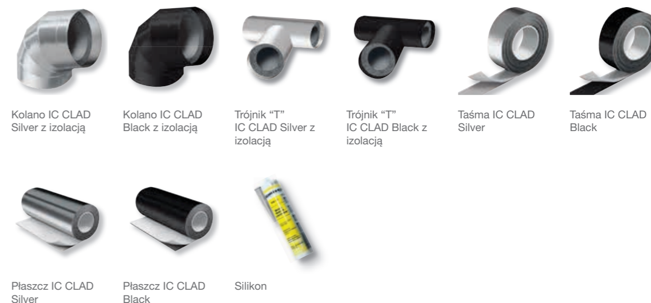
Kolano IC CLAD Silver z izolacją Kolano IC CLAD Black z izolacją Trójnik "T" IC CLAD Silver z izolacją Trójnik "T" IC CLAD Black z izolacją Taśma IC CLAD Silver Taśma IC CLAD Black Płaszcz IC CLAD Silver Płaszcz IC CLAD Black Silikon

Szczegółowe informacje znajdują się w sekcji poświęconej akcesoriom.